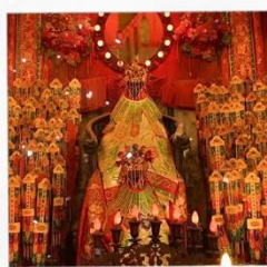
เจ้าแม่กวนอิมวัดสองฮ่า