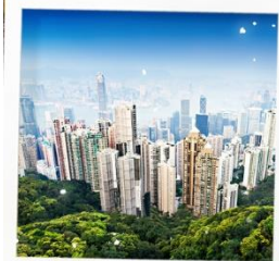
จุดชมวิวยุทธศาสตร์