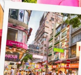
ช้อปปิ้งย่านมงก๊ก