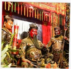
เทพเจ้ากวนอู วัดกวนไท