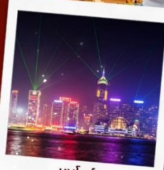
ชมโชว์ SYMPHONY OF LIGHT