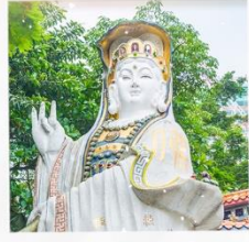
เจ้าแม่กวนอิมรพหลัสนีย์