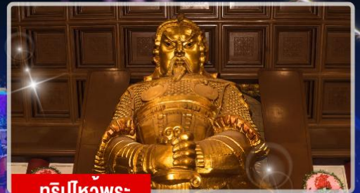
กริปไหว้พระ