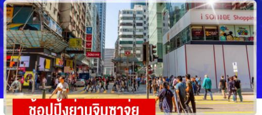
ช้อปปิ้งย่านจิมซาจุย