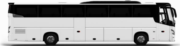
ตัวอย่างรูปภาพรถ 1 ชั้น

หากประเภทห้องที่ท่านริเคอสมามีเกิน อาทิ เช่น ริเคอสห้องพักเป็น TWIN BED หรือ DOUBLE BED ทางบริษัทขอสงวนสิทธิ์ในการปรับประเภทห้องพัก เป็นตามที่โรงแรมมีอยู่ โดยไม่ต้องแจ้งให้ทราบล่วงหน้า