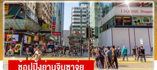
ช้อปปิ้งย่านจิมซาจุย