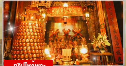
ทริบิไหว้พระ