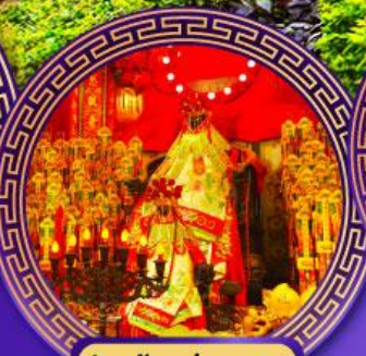
วัดเจ้าแม่กวนอิม ฮ่องงำ