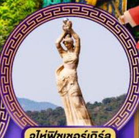
จูไห่พีซเซอร์กิส