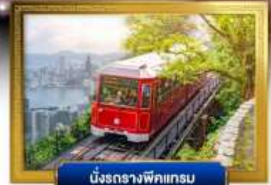
นั่งรถรางพิกแนม