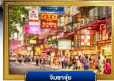
จิมซาจุ่ย