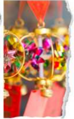
วัดแขกหมิว

นำท่านขอพรเพื่อเป็นสิริมงคล วัดแห่งนี้เป็นวัดที่คน ฮ่องกงให้การเคารพนับถือเป็นอย่างมาก เป็นวัดเก่าแก่ และมีชื่อเสียงที่สุดวัดหนึ่งของฮ่องกง เป็น 1 ในวัดของ ฮ่องกงที่ทุกท่านห้ามพลาดเลยก็ด้วย