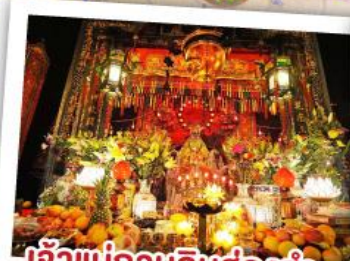
เจ้าแม่กวนอิมฮ่องฮำ