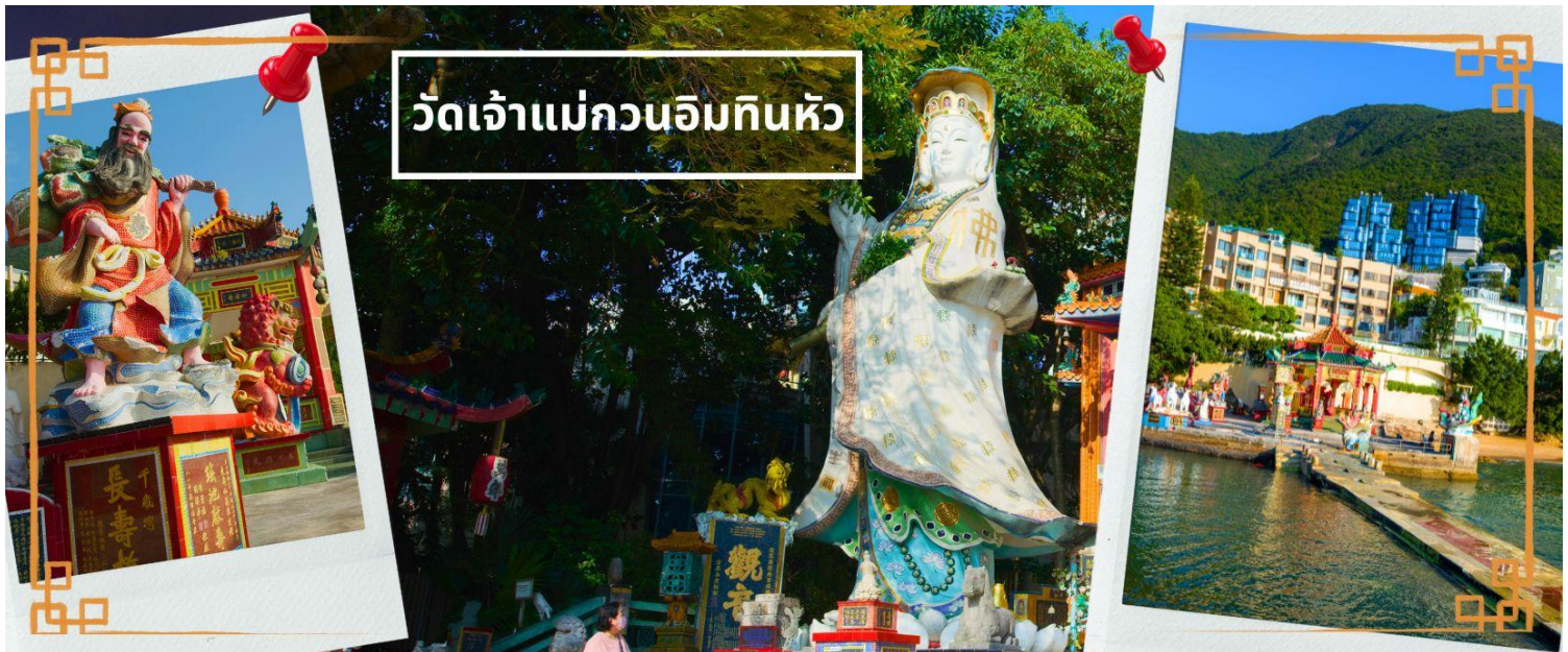
วัดเจ้าแม่กวนอิมหินหัว

จากนั้นนำท่านเดินทางสู่ วัดเจ้าแม่กวนอิมหินหัว อ่าวรีพัลส์เบย์ (TIN HAU TEMPLE REPULSE BAY) ตั้งอยู่ริมทะเล เป็นสถานที่ท่องเที่ยวสำคัญสร้างขึ้นในปี.ศ.1993วัดแห่งนี้ถูกสร้างขึ้นเพื่อคุ้มครองชาวประมงในการออกเรือไปหาปลา ซึ่งเป็นหนึ่งในวัดที่เก่าแก่ที่สุดของฮ่องกง บริเวณวัดจะมีเจ้าแม่กวนอิมองค์ใหญ่ปางประทานพรตั้งอยู่ เป็นเทพที่ชาวฮ่องกงและคนจีนให้ความเคารพนับถือมากที่สุด สามารถขอพรได้ทุกเรื่อง วัดนี้เป็นที่นิยมมีนักท่องเที่ยวเดินทางมาขอพรกันมากมาย เพราะเชื่อในความศักดิ์สิทธิ์ และยังมี เจ้าแม่ทับทิม หรือเทพธิดาแห่งท้องทะเล องค์ใหญ่ ซึ่งคนฮ่องกง คนมาเก๊า และคนจีน ที่อยู่ริมทะเล ชาวประมง นักเดินเรือหรือผู้ที่เดินทางทางเรือเป็นประจำ จะนับถือเจ้าแม่ทับทิมเป็นอย่างมาก มีความเชื่อว่าเจ้าแม่ทับทิมจะปกป้องเราจากภัยอันตราย