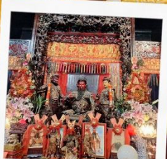
เทพเจ้ากวนอู วัดกวนไท