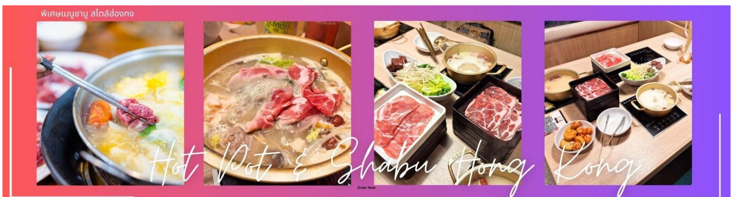
พิเศษเมนูชาบู สไตล์ฮ่องกง

จากนั้นนำทุกท่านเดินทางสู่ วัดเจ้าแม่กวนอิมฮ่องฮ่า (HUNG HOM KWUN YUM TEMPLE) เป็นหนึ่งในวัดที่ชาวฮ่องกงนั้นเลื่อมใสกันมาก ด้วยความที่เจ้าแม่กวนอิมนั้นเป็นเทพเจ้าแห่งความเมตตา ฉะนั้นเมื่อใครมีทุกข์