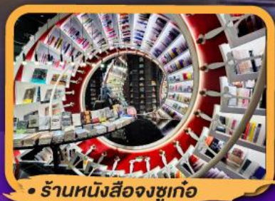
• ร้านหนังสือจิงซูเก๋