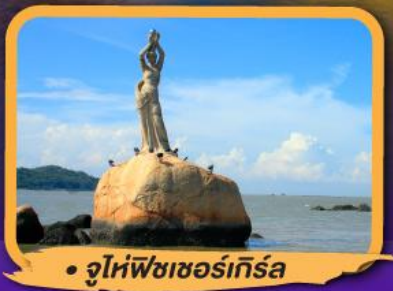
• จูไห่พีชเชอร์ทีร์รา