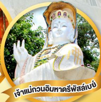
เจ้าแม่กวนอิมหาดริ์พิสลัเบย์