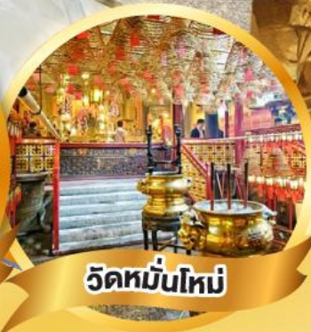
วัดหมื่นโหม่