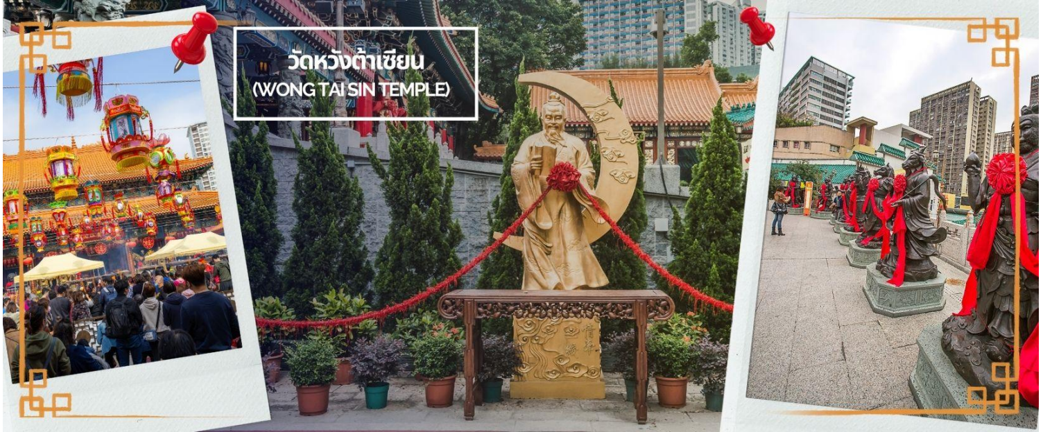
วัดหวังต้าเซียน (WONG TAI SIN TEMPLE)

รับคำอวยพรให้อยู่คู่กันอย่างร่มเย็นเป็นสุขซึ่งจะปรากฏตัวยามค่ำคืนภายใต้แสงจันทร์เป็นเทพเจ้าผู้เป็นอมตะที่อาศัยอยู่บนดวงจันทร์และลงมาโลกมนุษย์เพื่อผูกด้ายดวงชะตาระหว่างคู่รักซึ่งเมื่อคู่กันแล้วก็จะไม่แคล้วคลาดกัน