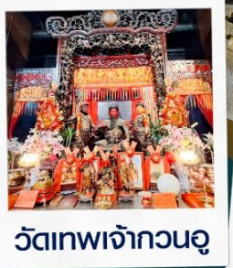
วัดเทพเจ้ากวนอู