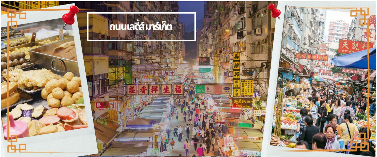
ถนนเลดี้ส์ มาร์เก็ต

จากนั้นนำท่านเดินทางสู่ ย่านมงก๊ก เป็นย่านที่มีความคึกคักที่สุดแห่งหนึ่งในเกาะฮ่องกงก็ว่าได้ เป็นสวรรค์ของนักช้อปปิ้งหนึ่งที่ว่าที่สายช้อปปะพลาดไม่ได้ นับได้ว่าเป็นย่านช้อปปิ้งที่คึกคักมากอีกแห่งหนึ่งของฮ่องกงเพราะเป็นย่านช้อปปิ้งที่มีทั้งร้านค้า และคนที่มาช้อปปิ้งจากที่ต่างๆ มากมายไม่ขาดสายตั้งแต่กลางวันยันกลางคืนเป็นถนนช้อปปิ้งที่มีสีสันมาก ถ้าเทียบกับญี่ปุ่นแล้วก็เปรียบเหมือนการเดินทางอยู่ที่ชิบูย่าเลยก็ว่าได้ และยังมี ถนนเลดี้ส์ มาร์เก็ต (LADIES MARKET) ที่มีทั้งเครื่องสำอาง เสื้อผ้า รองเท้า กระเป๋า เครื่องประดับมากมายให้เลือกช้อป อีกทั้งยังมีร้านอาหารและเครื่องดื่ม ที่ขึ้นชื่อหลากหลายชนิด ให้ทุกท่านได้ลองลิ้มรสอีกมากมาย