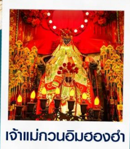
เจ้าแม่กวนอิมสองอ้า