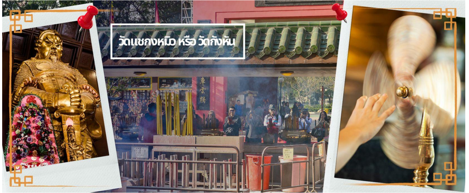
วัดเขกงหมือ หรือ วัดกั๊งหัน

จากนั้นนำท่านเดินทางสู่ ย่านมงก๊ก เป็นย่านที่มีความคึกคักที่สุดแห่งหนึ่งในเกาะฮ่องกงก็ว่าได้ เป็นสวรรค์ของนักช้อปปิ้งหนึ่งที่ว่าที่สายช้อปปะพลาดไม่ได้ นับได้ว่าเป็นย่านช้อปปิ้งที่คึกคักมากอีกแห่งหนึ่งของฮ่องกงเพราะเป็นย่านช้อปปิ้งที่มีทั้งร้านค้า และคนที่มาช้อปปิ้งจากที่ต่างๆ มากมายไม่ขาดสายตั้งแต่กลางวันยันกลางคืนเป็นถนนช้อปปิ้งที่มีสีสันมาก ถ้าเทียบกับญี่ปุ่นแล้วก็เปรียบเหมือนการเดินทางอยู่ที่ชิบูย่าเลยก็ว่าได้ และยังมี ถนนเลดี้ส์ มาร์เก็ต (LADIES MARKET) ที่มีทั้งเครื่องสำอาง เสื้อผ้า รองเท้า กระเป๋า เครื่องประดับมากมายให้เลือกช้อป อีกทั้งยังมีร้านอาหารและเครื่องดื่ม ที่ขึ้นชื่อหลากหลายชนิด ให้ทุกท่านได้ลองลิ้มรสอีกมากมาย