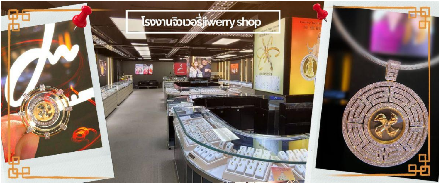
โรงงานจิวเวลรี่jewelry shop

กลางวัน ๑๐ | บริการอาหารกลางวัน ณ ภัตตาคาร พิเศษเมนูชาบู สไตส์ฮ่องกง (4)