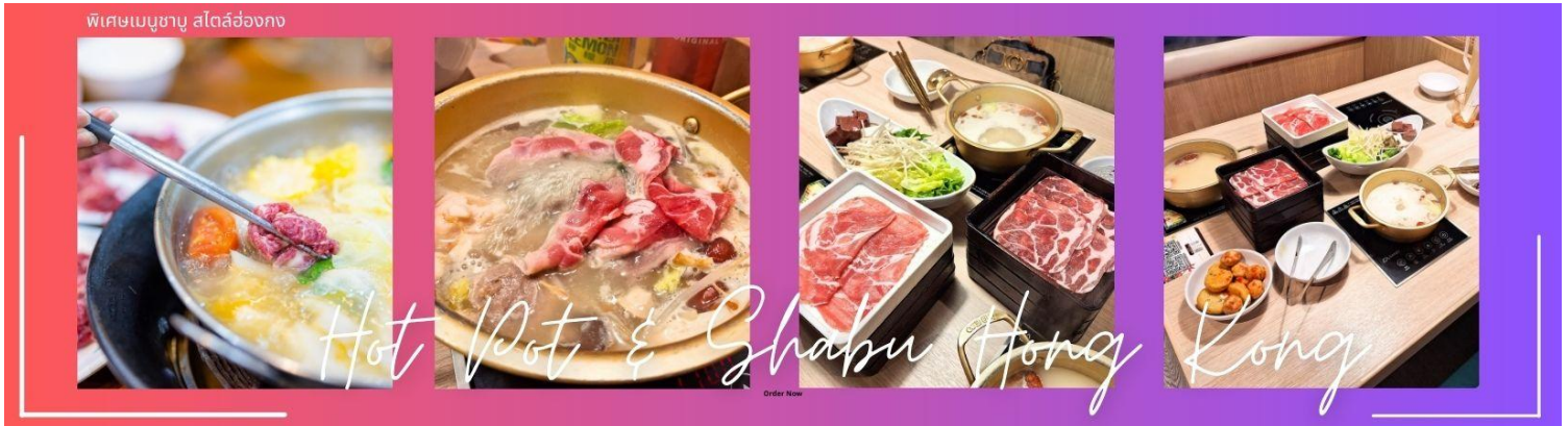
พิเศษเมนูชาบู สไตส์ฮ่องกง

กลางวัน ๑๐ | บริการอาหารกลางวัน ณ ภัตตาคาร พิเศษเมนูชาบู สไตส์ฮ่องกง (4)