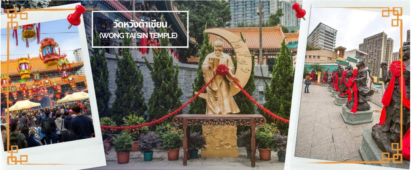
วัดหวังต้าเซียน (WONG TAI SIN TEMPLE)

และยืนยาว เมื่อไปถึงจะเห็นรูปปั้นของเทพหยุกโหลวอยู่ตรงกลางเมื่อหันหน้าเข้าหาเทพหยุกโหลวจะพบรูปปั้นเจ้าบ่าว อยู่ทางขวา และรูปปั้นเจ้าสาวอยู่ทางซ้าย โดยมีด้ายแดงผูกโยงจากเจ้าบ่าวและเจ้าสาวมาที่เทพหยุกโหลว ซึ่งท่านจะคอยทำหน้าที่จดรายชื่อคู่รัก เชื่อกันว่าสมุดที่ผู้ใฝ่มาถือในมือ คือบัญชีรายชื่อคู่รักที่จะได้รับคำอวยพรให้อยู่คู่กันอย่างร่มเย็นเป็นสุขซึ่งจะปรากฏด้วยยามค่ำคืนภายใต้แสงจันทร์เป็นเทพเจ้าผู้เป็นอมตะที่อาศัยอยู่บนดวงจันทร์ และลงมาโลกมนุษย์เพื่อผูกด้ายดวงชะตา ระหว่างคู่รักซึ่งเมื่อคู่กันแล้วก็จะไม่แคล้วคลาดกัน