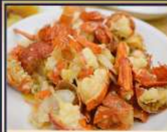
กุ้งมังกรอบซีส