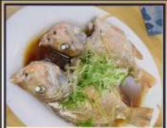
ปลาหนังซีอิ๊ว