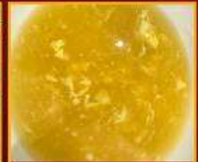
ซุปข้าวโพด