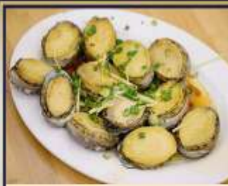
เป๋าฮื้อสดนึ่ง