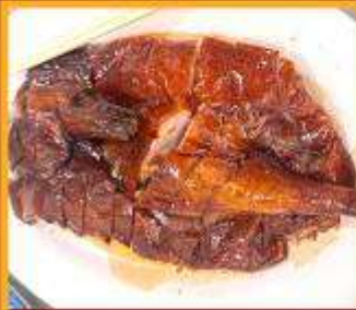
ท่านอย่าง