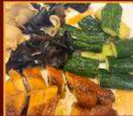
ไก่ แดงกวา เห็ดหูหนู