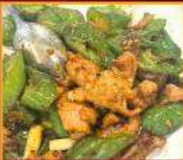
หมูผัดพริกหยวก