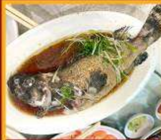
ปลาหนึ่งซีอิ้ว