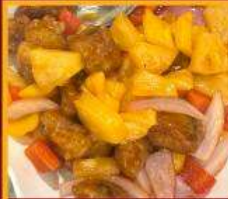
กระดุกหมูผัดเปรี้ยวหวาน