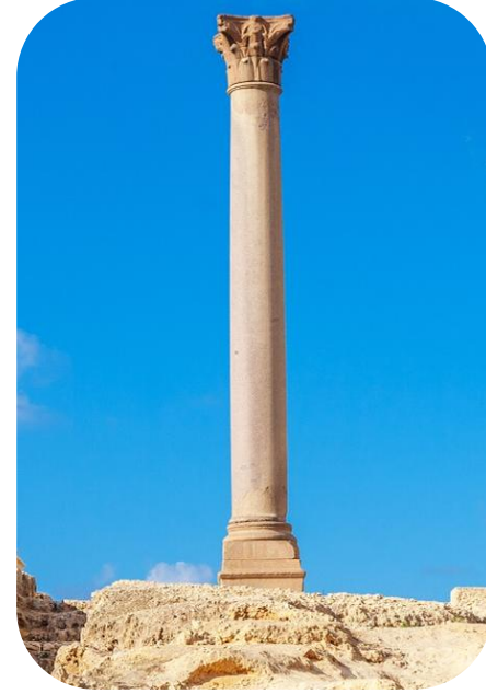
จูเลียสซีซาร์จึง ปัจจุบันนี้เหลือเพียง

TIBA PYRAMIDS HOTEL ระดับ 3 ดาว หรือเทียบเท่า