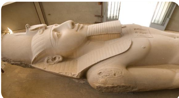
ฟาโรห์รามเสสที่ 2 อีกด้วย

เช้า บริการอาหารเช้า ณ ห้องอาหารของโรงแรม (4)