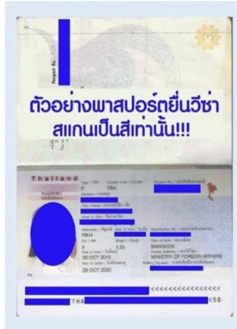
ตัวอย่าง

2. รูปถ่ายสี พื้นด้านหลังสีขาว ขนาด 2 x 2 นิ้ว เป็นไฟล์ JPEG เท่านั้น