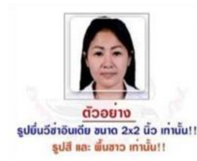
ตัวอย่าง

3. สำคัญ!! สำหรับท่านที่เคยเดินทางไปประเทศอินเดียในพาสปอร์ตเล่มปัจจุบัน รบกวนขอสำเนาวีซ่าครั้งก่อนแนบมาด้วย