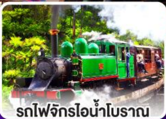
รถไฟจักรไอน้ำโบราณ