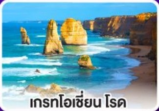
เกรทโอเชียน โรด