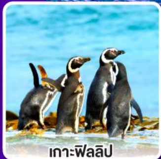
เกาะฟิลลิป

กึ่งลือบสเตอร์ท่านละ 1 ตัว พร้อมไวน์ชั้นเยี่ยม