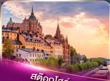
สต็อกโฮล์ม เวนิสแห่งยุโรปเหนือ