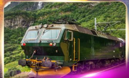
รถไฟสายโรแมนติก ฟลัมส์บาน่า