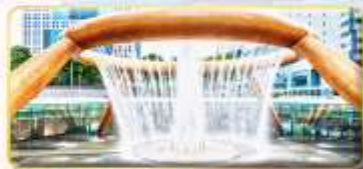
Fountain of Wealth