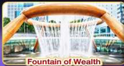
Fountain of Wealth