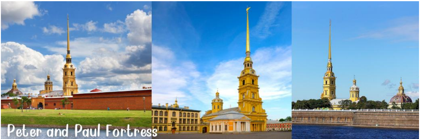
Peter and Paul Fortress