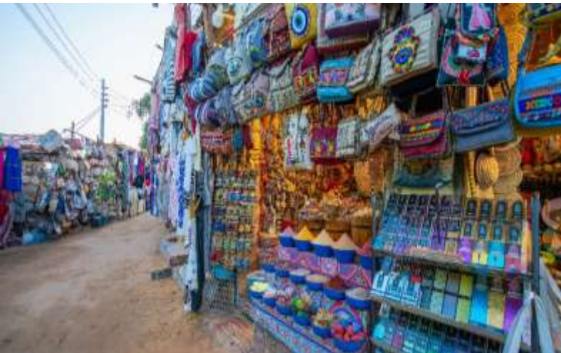
วัน ก่อนวันเดินทาง)