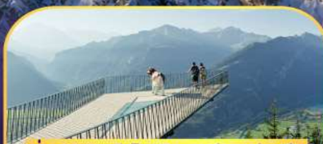
นั่งรถกระเช้าไฟฟ้า ชาร์เตอร์ คูสุม