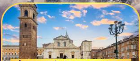
ถ่ายภาพกับมหาวิหารตูริน