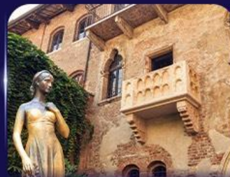
เขื่อนบ้านจูเลียต เวโรนา