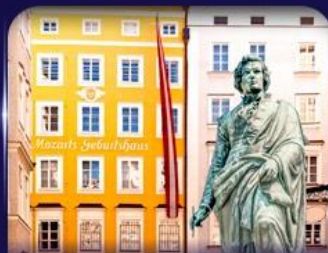
บ้านเกิดโมซาร์ท ซาลซ์บูร์ก