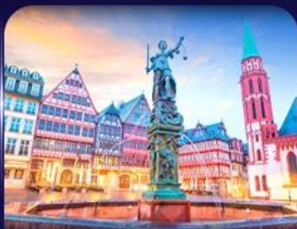
จัตุรัสโรเมอร์ แพรงก์เฟิร์ต