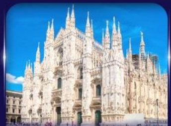
เซ็คจินวิหารดูโอโม มิลาน