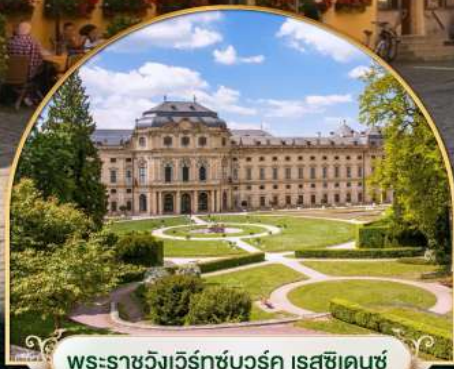
พระราชวังเวิร์ทซ์บวร์ค เรสซิเดนซ์