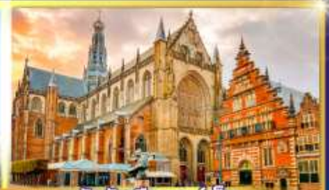
จัตุรัสเมืองฮาร์เล็ม

พรมแดนเมืองแปลกเนเธอร์แลนด์และเบลเยียม เติมน้องเคลฟท์ เมืองเครื่องปั้นดินเผาระดับโลก ฮาร์เล็มเมืองมั่งคั่งที่สุดของเนเธอร์แลนด์