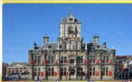
อาคารเมืองเก่าคลองเมืองเคลฟท์