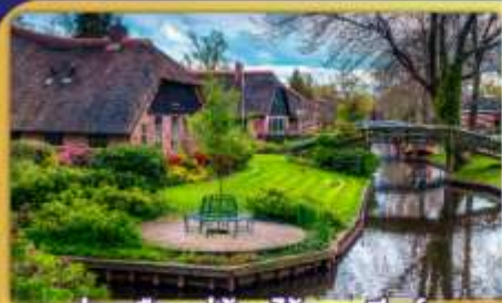
ล่องเรือหมู่บ้านโรกนันทูร์