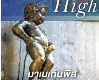
มานเนกันพิส