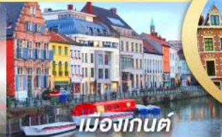
เมืองเกนต์