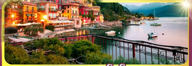
ทะเลสาบโลโบ