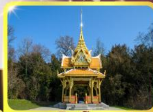
ศาลาไทยไชยาน์