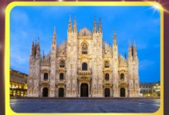
มหาวิหารแห่งเมืองมิลาน