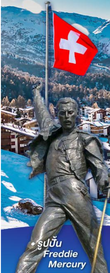
• รูปปั้น Freddie Mercury

พิชิต 5 เวก์ริก, เวก์อาร์เคอร์คัม เวก์จุงเฟร่า, เวก์กลาเซียร์ 3000 และ เวก์รอนเนออร์เกรต