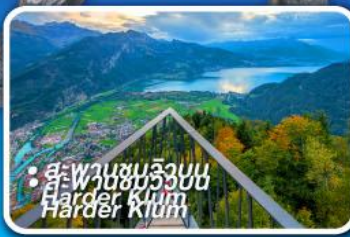
• สะพานขมอีวบบน Harder Kletterbahn