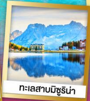
ทะเลสาบมิซูรีน่า