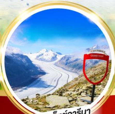
อาเล็ซอาร์นา