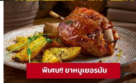
พิเศษ! ขาหมูเยอรมัน

เย็น ๑๑ รับประทานอาหารเย็น (มื้อที่6) ที่พัก : DORMERO Hotel Zürich Airport หรือโรงแรมและเมืองระดับใกล้เคียงกัน (ชื่อโรงแรมที่ท่านพัก ทางบริษัทจะทำการแจ้งพร้อมใบนัดหมาย 5-7 วัน ก่อนวันเดินทาง)