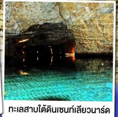
ทะเลสาบใต้ดินเซนท์เลียวนาร์ด

ล่องเรือชมทะเลสาบใต้ดินเซนท์เลียวนาร์ด ทะเลสาบใต้ดินลึกลับ สุดUnseenแห่งสวิตเซอร์แลนด์