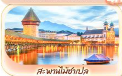
สะพานไมซ์าเปล