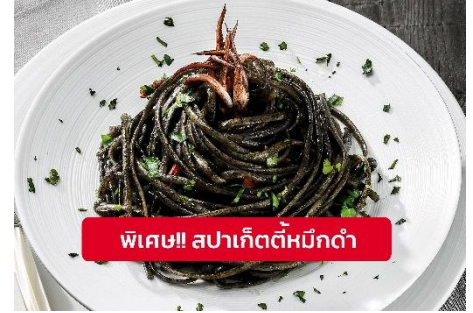
พิเศษ! สปาเก็ตตี้หมึกดำ

Highlight! เมื่อเยือนเกาะเวนิส เมื่อบูที่ขึ้นชื่อและหากได้มาต้อง ได้ลิ้มลอง สปาเก็ตตี้ผัดซอสหมึกดำที่คลุกเคล้ากับความหอม นุ่มนวลกับบรรยากาศ