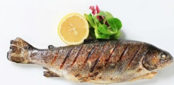
พิเศษ! ปลาเทราต์ย่าง

นำท่านเดินทางสู่ เมืองมรดกโลกเชสกี คุรมลอฟ (Cesky Krumlov) สาธารณรัฐเช็ก (ระยะทาง 210 กม./ 3.30 ชม.) ล้อมรอบด้วยแม่น้ำ Vltava ทำให้เมืองแห่งนี้มีลักษณะ