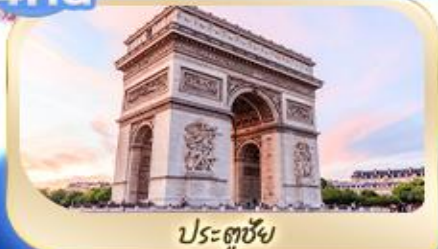
ประตูชัย