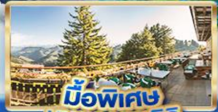
มือพิเศษ บนยอดเขาริทิ