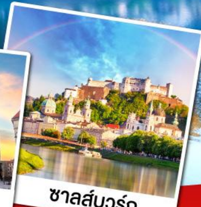
ชาลส์บวร์ก