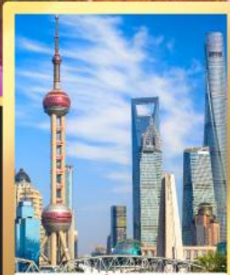
เซี่ยงไฮ้