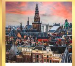
อัมสเตอร์ดัม