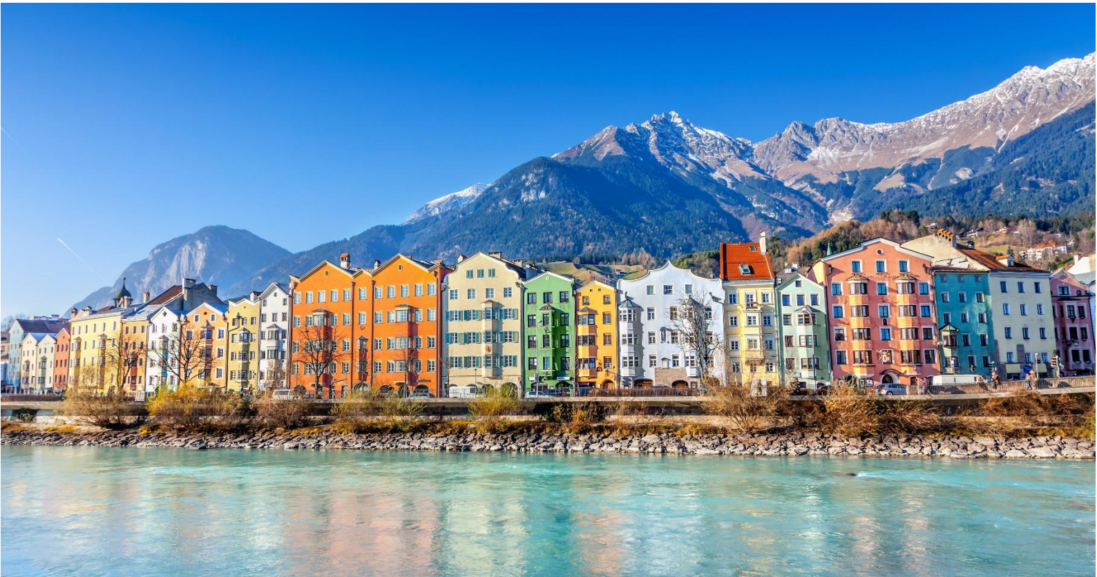
ถ่ายภาพชื่อดัง

จากนั้นให้ท่านเที่ยวชมเมืองอินส์บรุคที่มีจุดเด่นอยู่ที่ตัวอาคารบ้านเรือนสีลูกกวาดที่ตั้งอยู่เรียงราย เป็นจุด