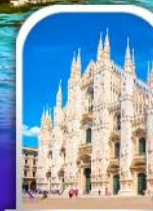
DUOMO MILAN ITALY