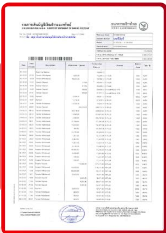
ตัวอย่าง Bank Statement ที่ผู้สมัครต้องขอจากธนาคาร

3.4 ปรับสมุดบัญชีธนาคารตัวจริง และเตรียมไปในวันที่ยื่นวีซ่า