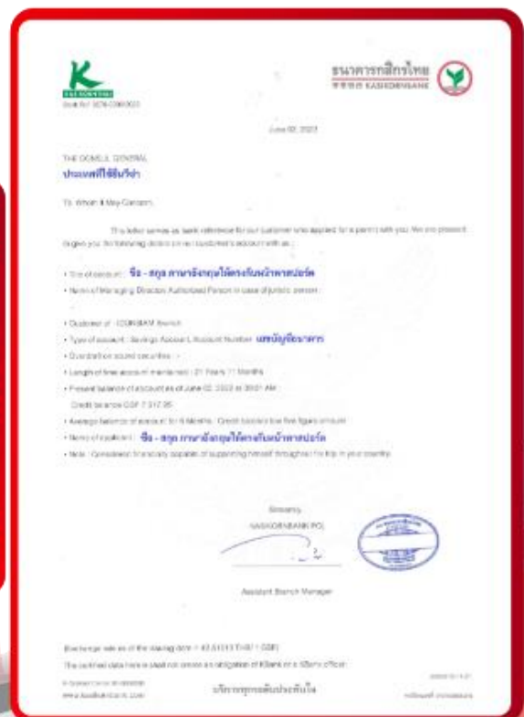
ตัวอย่าง Bank Guarantee ที่ผู้สมัครต้องขอจากธนาคาร