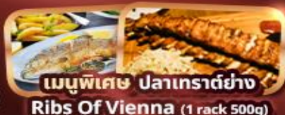
เมนูพิเศษ ปลาเทราต์ย่าง Ribs Of Vienna (1 rack 500g)