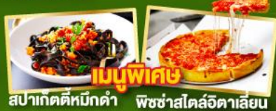
เมนูพิเศษ สปาเก็ตตี้หมักดำ พิชซ่าสไตล์อิตาลี