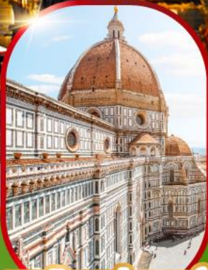
มหาวิหารฟลอเรนซ์