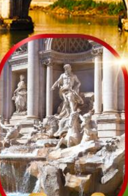
น้ำพุทรวี่

เดินทาง 15-22 พ.ย.67 28 พ.ย. - 5 ธ.ค.67 26 ธ.ค.67 - 2 ม.ค.68(ปีใหม่) 28 ธ.ค.67 - 4 ม.ค.68(ปีใหม่)