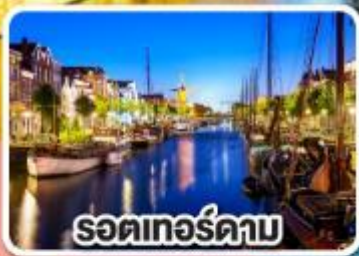
รอดเทอร์ดาบ