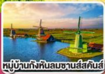
หมู่บ้านกังหันลมชาวนัสสัมคีนส์