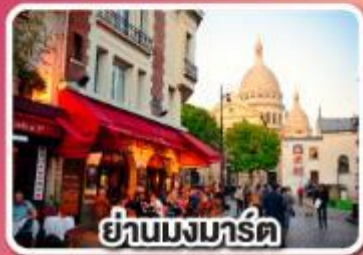
ย่านมงมาร์ต