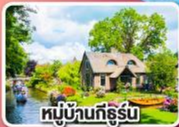
หมู่บ้านกีร์รัม

พักปารีสและอัมสเตอร์ดัม อย่างละ 2 คืน ไม่ต้องเปลี่ยนโรงแรมบ่อย