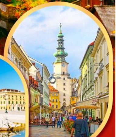
บราติสลาวา