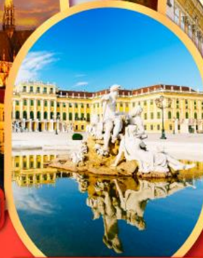
พระราชวังซินบรุนน์