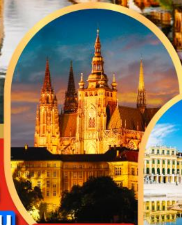
ปราสาทปราก