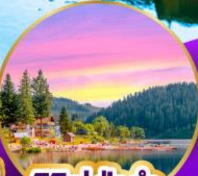
ททิเซ่ ปาดำ