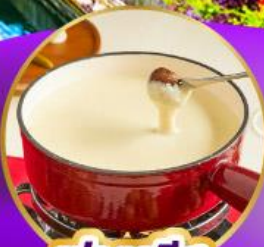
ฟองดูซีส