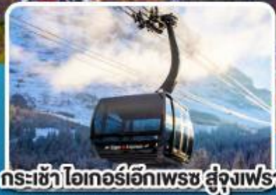
กระเช้า ไอเกอร์เอ็กสเพรส สู่ยอดเขาจุงเฟรา

อิตาลี สวิตเซอร์แลนด์ ฝรั่งเศส 10 วัน 7 คืน