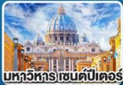
มหาวิหาร เซนต์ปีเตอร์