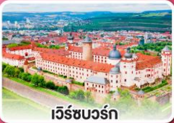
เว็ร์ชบวร์ค

เที่ยวเก็บครบเส้นทาง สายโรแมนติก เยอรมัน จากเว็ร์ชบวร์คสู่เอาคส์บวร์ค