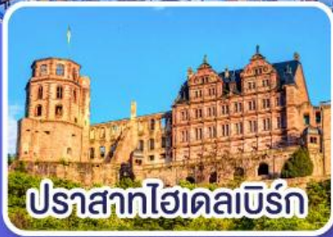
ปราสาทไฮเดลเบิร์ก