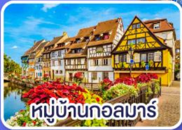
หมู่บ้านกอลมาร์