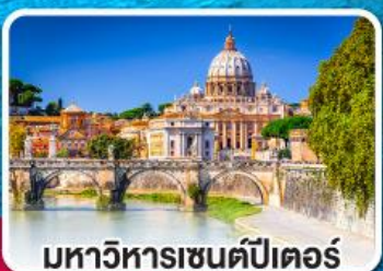
มหาวิหารเซนต์ปีเตอร์